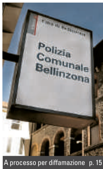
A processo per diffamazione p. 15

Intimato l'atto d'accusa al comandante della PolCom