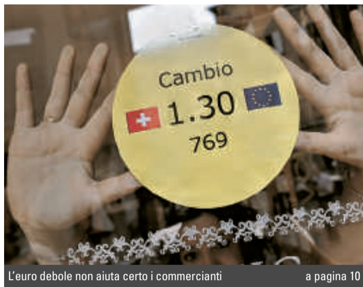
L'euro debole non aiuta certo i commercianti a pagina 10

Consumi in calo, è crisi per il dettaglio In Ticino 500 impieghi a rischio